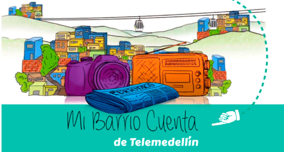
Ilustración tomada de la página oficial de Teledellín, portada de su programa "Mi Barrio Cuenta"