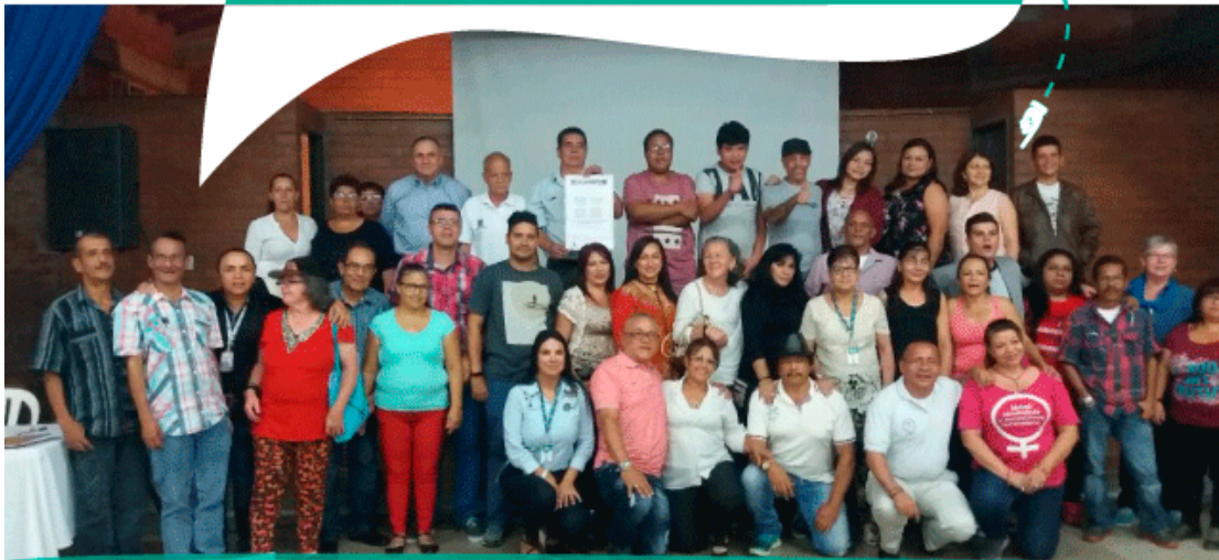
Instalación Consejo Comunal de Planeación, comuna 3. 24 de febrero de 2018, I.E Manuela Beltrán.

Son varios los integrantes de los grupos gestores, pertenecientes al proceso de Gestión Territorial de Salud basado en Comunidad, que también fueron seleccionados a los Consejos Comunales de Planeación.